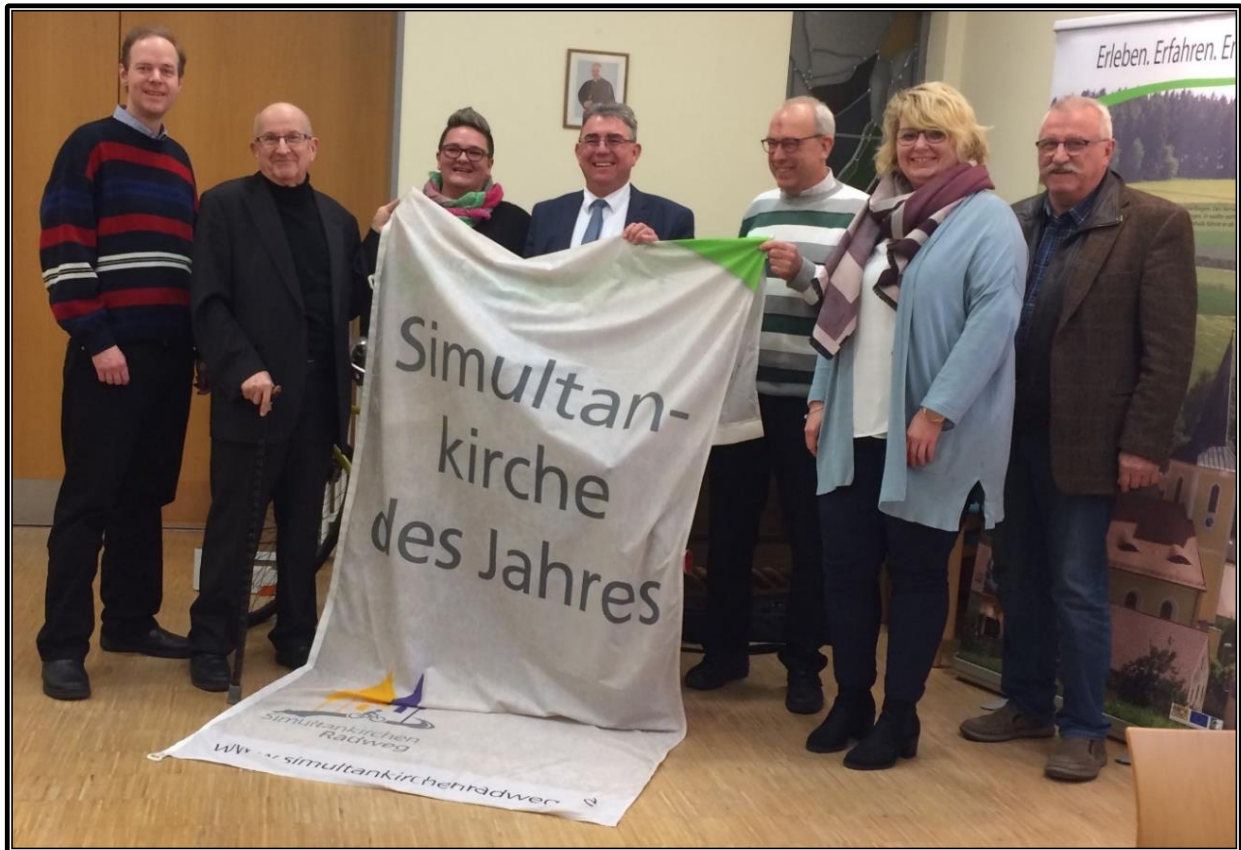
Jahreshauptversammlung Förderverein Simultankirchen in der Oberpfalz e.V.

Auch heuer zeichnete der Förderverein Simultankirchen in der Oberpfalz wieder zwei Gotteshäuser als „Simultankirchen des Jahres“ aus: Die Kirche Hl. Dreifaltigkeit in Freihung (heute katholisch) und die evangelische Katharinenkirche in Thansüß in der Marktgemeinde Freihung.